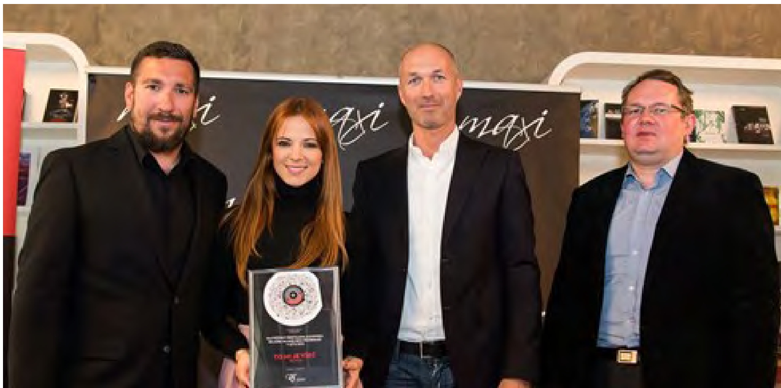
IPF vsako leto podeli nagrado za največkrat predvajano slovensko skladbo na radijskih programih.