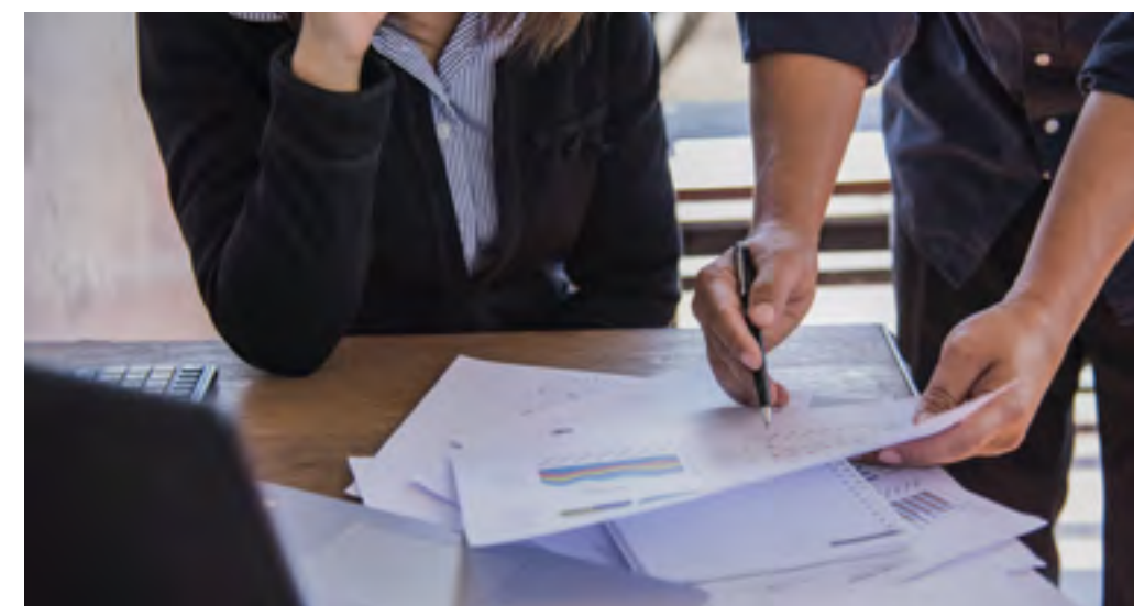
IPF z e-računi in razvojem portala za prijavo uporabe glasbe uvaja do uporabnikov prijazno poslovanje in zmanjšuje ogljični odtis.

Standard kakovosti ISO 9001:2015 je izdala mednarodna organizacija ISO (International Standardisation Organization) leta 2015, na kar oznaka »:2015« tudi opozarja. To je peta izdaja standarda, ki zamenjuje tisto iz leta 2008. Do septembra 2018 sta veljavni obe izdaji, nato le še ISO 9001:2015. ISO certifikate sicer podeljujejo od leta 1987.