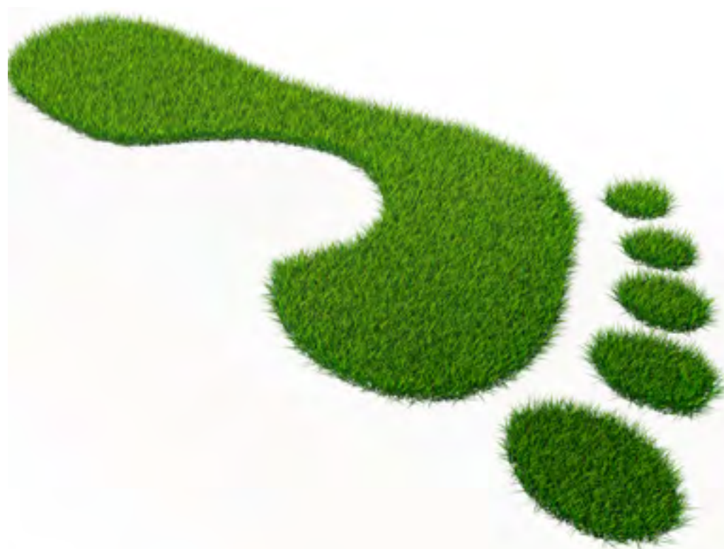
IPF z e-računi in razvojem portala za prijavo uporabe glasbe uvaja do uporabnikov prijazno poslovanje in zmanjšuje ogljični odtis.

Že pred časom smo na IPF-u uvedli brezpapirno poslovanje z e-računi. Poleg čisto konkretnih prihrankov pri tisku in poštnini takšen način obračunavanja glasbe uporabnikom skrajša čas za obdelavo podatkov in izboljša kakovost opravljenega dela, saj računov ni potrebno pretipkavati. Prejemanje e-računov je brezplačno in pomeni le spremenjen način pošiljanja računov, saj je vsebina računa enaka papirnati različici in jo enakovredno nadomešča. Uporabniki se lahko na e-račune